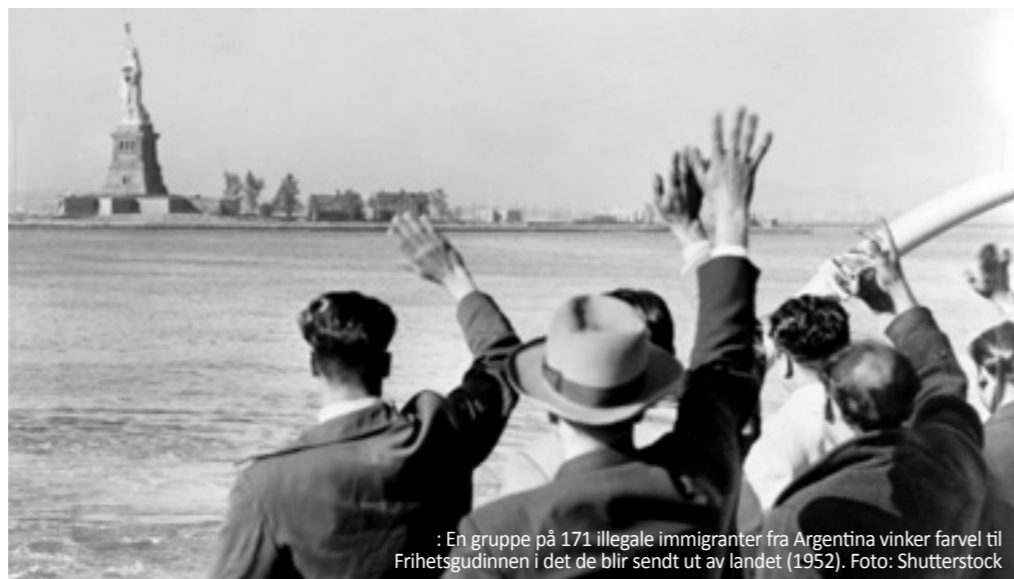
En gruppe på 171 illegale immigranter fra Argentina vinker farvel til Frihetsgudinnen i det de blir sendt ut av landet (1952).