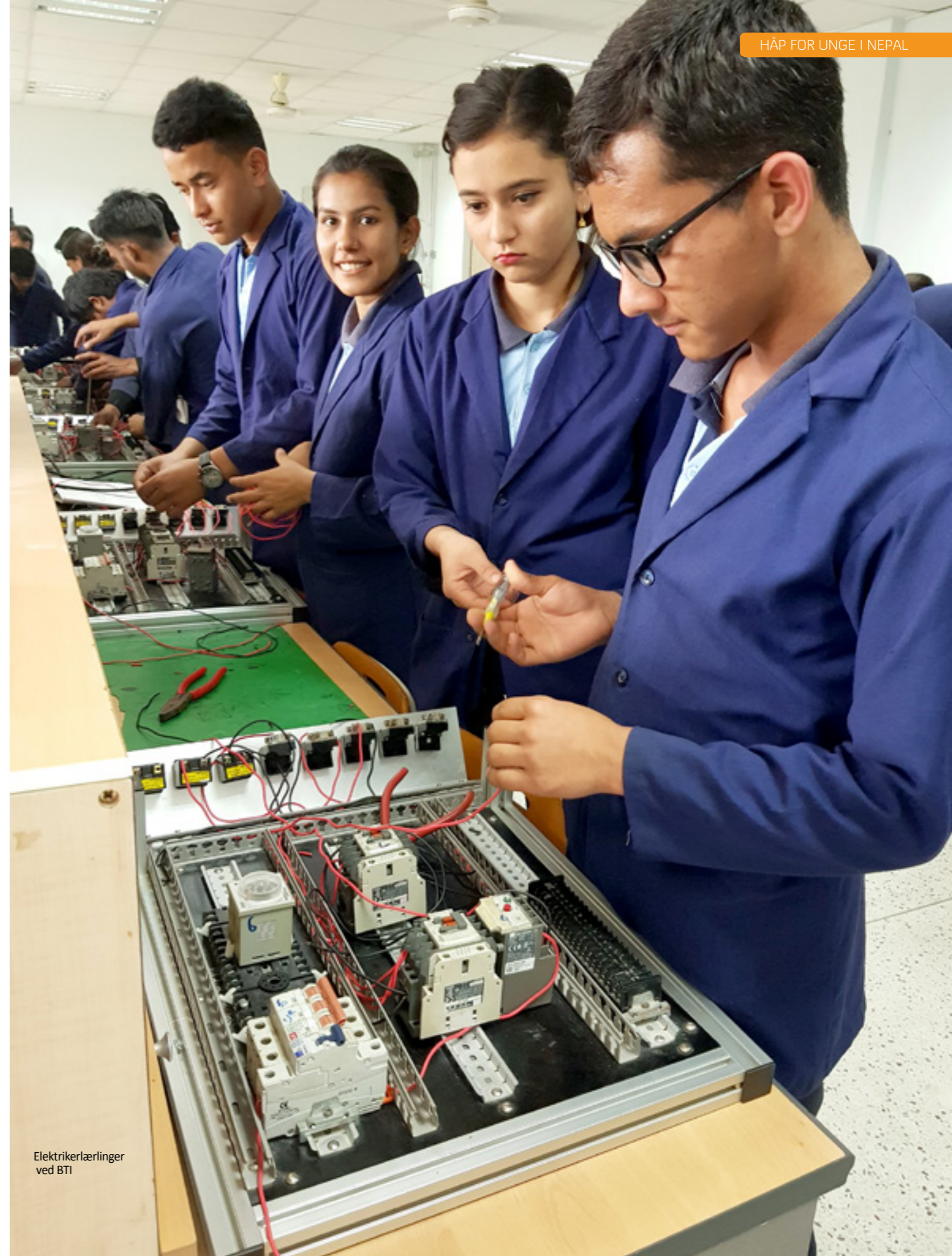
Elektrikerlærlinger ved BTI

Så da er det kanskje ikke så stor forskjell på Butwal og Norge? Økt konkurranse, større grad av mobilitet, nettstudier og digitalisering. Alt dette stiller krav til modernisering og effektiv markedsføring for å overleve i et samfunn med stadig raskere endringstakt. Sett i lys av dette er det avgjørende at BTI får på plass planlagte investeringer i nye skolebygg og får bygget opp sin kompetanse innen CNC og byggfag. Målet er at BTI også i fremtiden kan være en ressurs for lokalt næringsliv og førstevalg for unge som ønsker en utdanning som gir grunnlag for gode jobber. Skal de lykkes med et mål de tilbyr de unge og næringslivet det de etterspør i form av oppdatert kompetanse og riktig markedsføring. ●