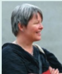
Lederen har ordet: