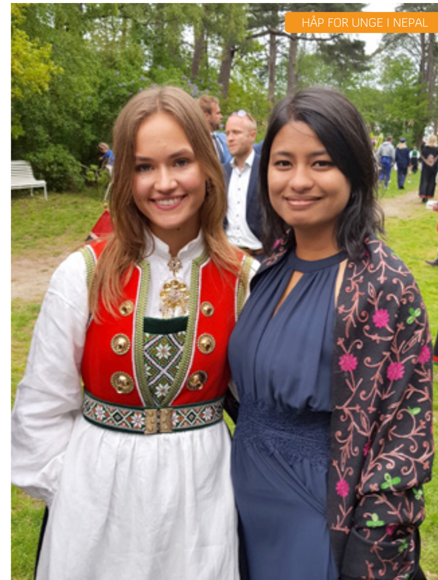
I året som har gått har Saru opplevd mye. Hun har også knyttet vennskap hun håper vil vare.