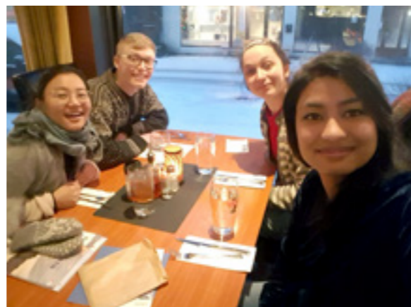
Saru mottok stipend fra Laget som ga henne mulighet til et år som utvekslingsstudent i Norge.