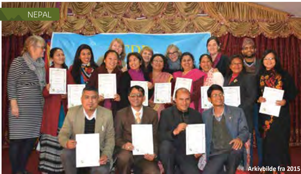
Arkivbilde fra 2015