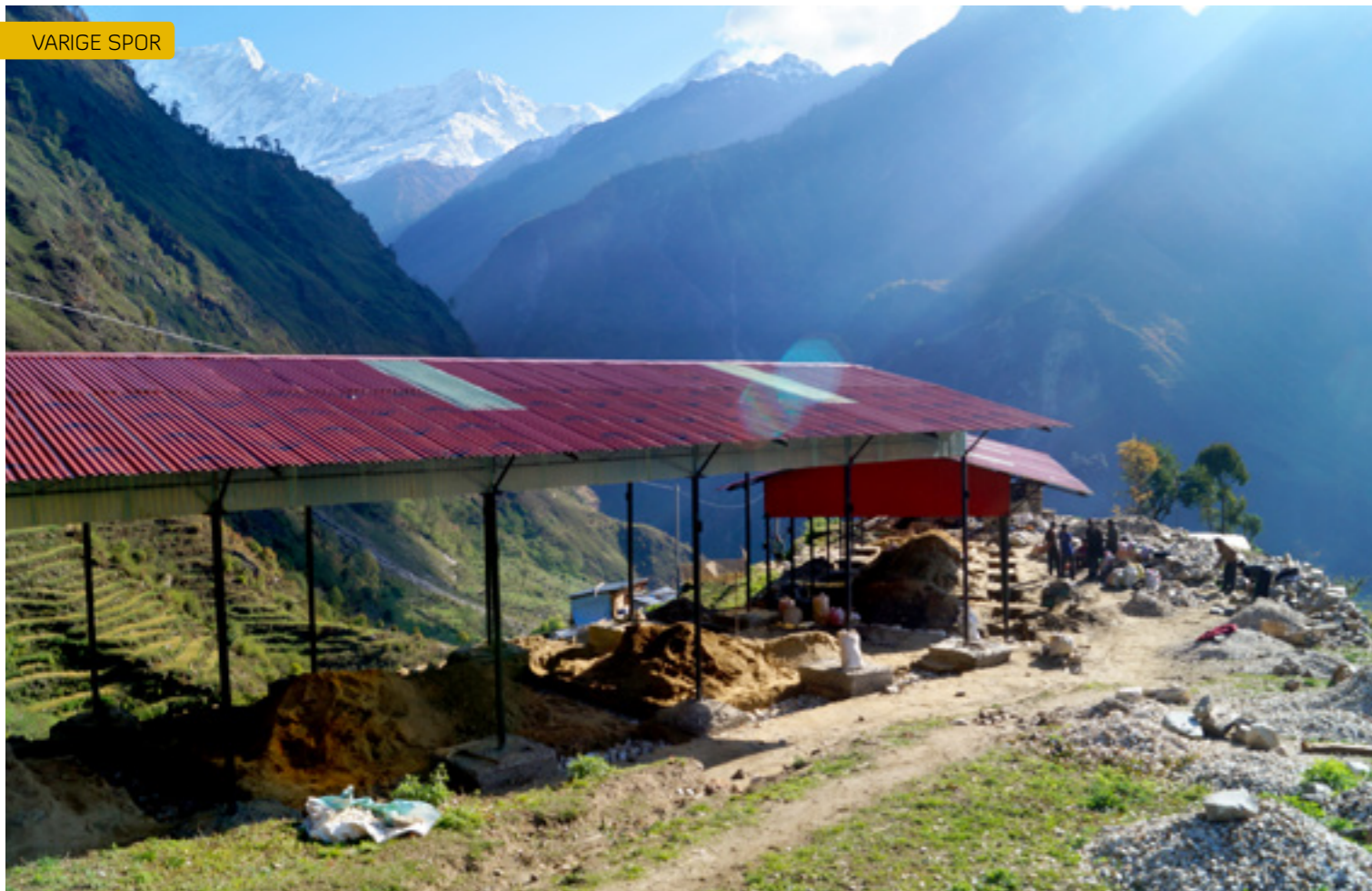
Et av skolebyggene som reiser seg.