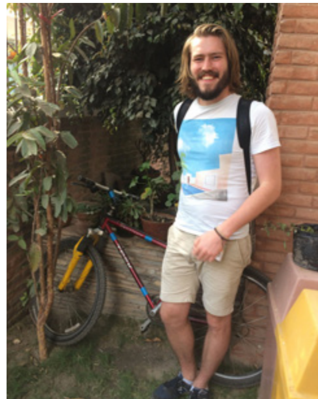
Sykkelen fra barndommen

– En ting jeg tenkte mye på under oppholdet, var hvordan samfunnet behandler