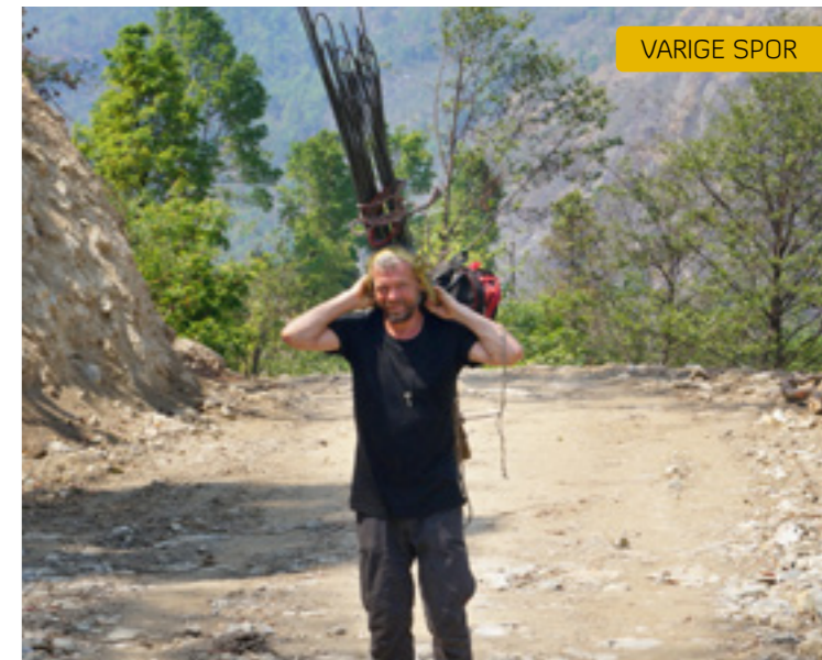
Geir med armeringsjern på ryggen.

Etter tre år i telt og presenningsskur, tre monsuntider og tre vintre, ser det ut til at folk får nye hus og landsbyer. Dette hadde vi håpet, men jeg hadde ikke våget å tro på at det ville skje, i allefall ikke så raskt.