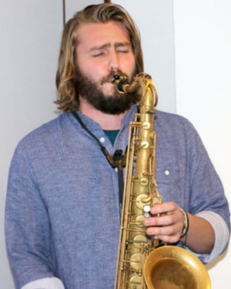
Minikonsert på den norske ambassaden i Kathmandu.