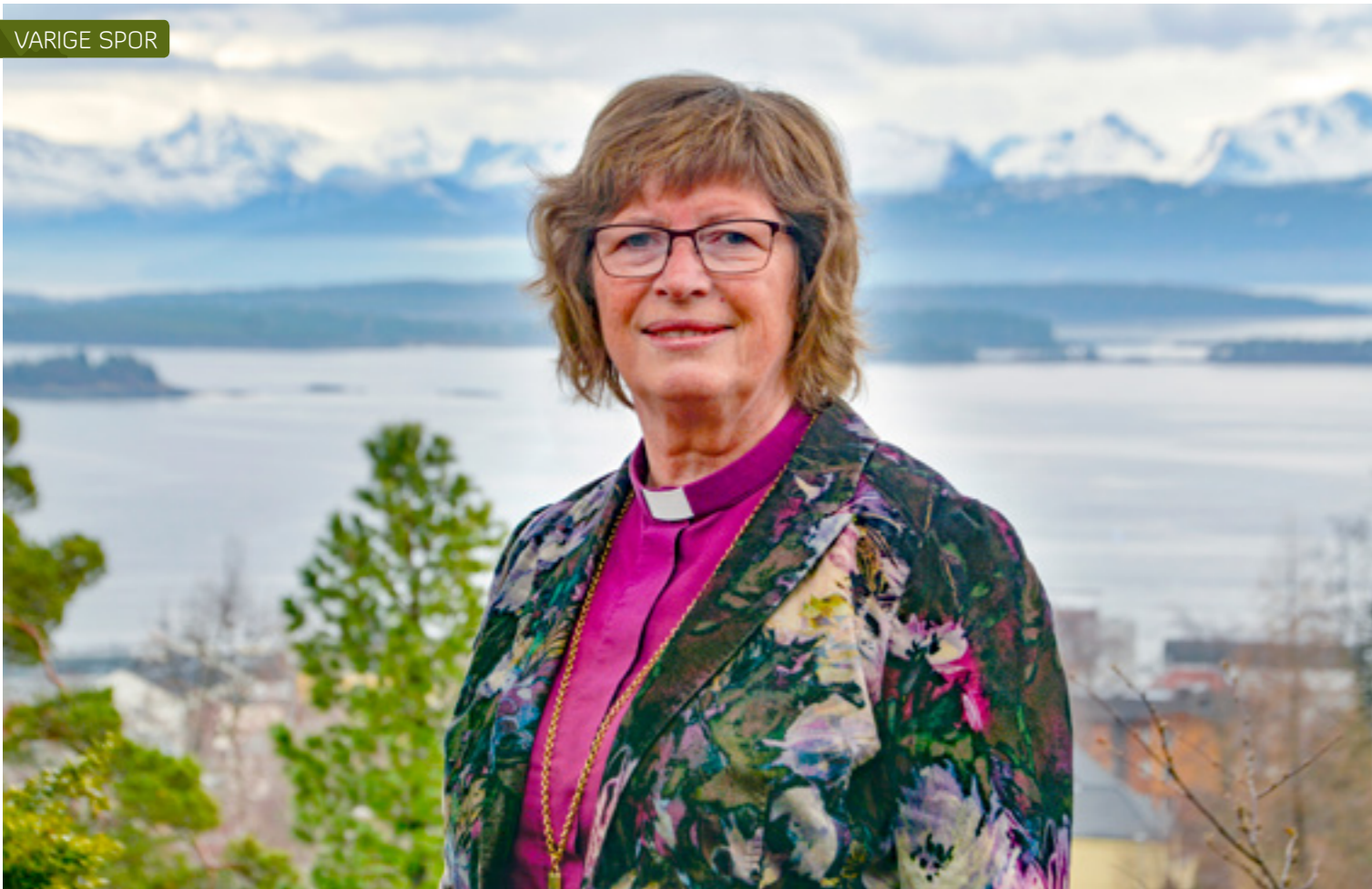
Utsiktspunktet på toppen ved Romsdalsmuseet i Molde by.