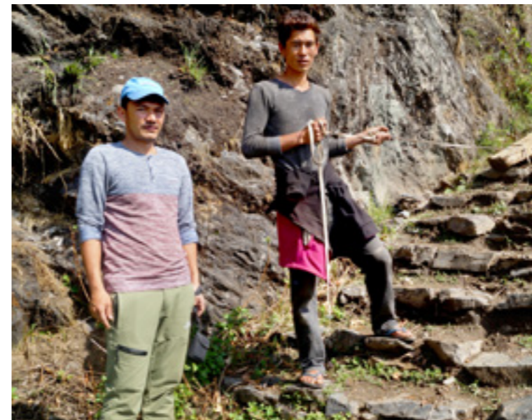
Betong, armeringsjern og tømmerstokker fraktes til fots på ufremkommelige veier.

I hver landsby bygges det nye hus! Dette er hus som bygges etter jordskjelvsikker metode, med armeringsjern vertikalt og horisontalt. Det tørrstables skiferstein, hentet på rygg fra nærmeste steinbrudd, og støpes inn lag med betong og armering hver ca 70 cm. Også nå må jeg fram med kameraet i hver landsby. Det er for godt til å være sant.