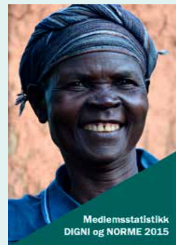
Medlemsstatistikk DIGNI og NORME 2015

– Gaveinntektene til HimalPartner økte med 72 % fra 2014 til 2015, mens offentlig støtte gikk opp med bare 48 %. Det betyr at, i den grad vi kan forholde oss til tallene i et så uvanlig år, bekrefter det at vi ikke lener oss på statsstøtten, men har lyktes med å skape økt engasjement blant folk til å gi mer.