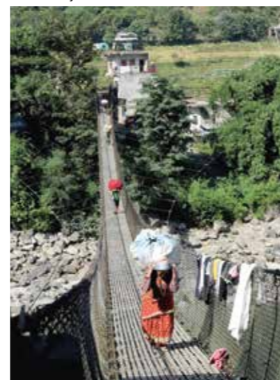
Ved mental sykdom blir byrdene ekstra tunge når skam og stigma får oss til å forsøke å skjule det istedenfor å snakke sant om livet.

Programme Manager - Mental Health United Mission to Nepal