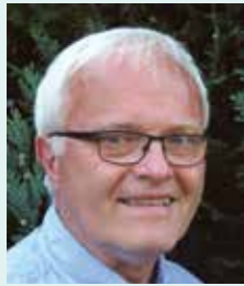
Styreleder har ordet: