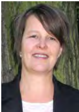
Generalsekretæren har ordet:

Det er flott å få nye medarbeidere. Det at begge har erfaring fra arbeidet i våre samarbeidsland er en bonus og en ekstra ressurs.